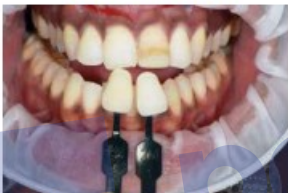
الشكل 1 أ و ب: يتم تسجيل الصور بالتسوية مع وميضون وجود الاستقطاب المتناوب لتوضيح التسميم الطبقي للظلال والسطح. Figs. 1a and 1b: Images are recorded in RAW format with and without the cross-polarization filters in place to facilitate illustration of the stratification of shades and surface finish/texture.